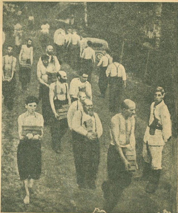
6. Nazi slave traders.

The whole population of Poland and other conquered countries has been reduced to slavery. The slaves are working 16 hours a day under most inhuman conditions and under an unbearable physical and mental strain. The illustration shows Jewish slaves who are compelled to work, almost naked, at temperatures up to 40 degrees below zero.